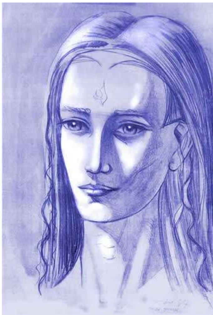
Ashtar - desenho de 1987

Todos os Vectores são operações de introdução de Energia Superiores nos Tecidos Tridimensionais Humanos.