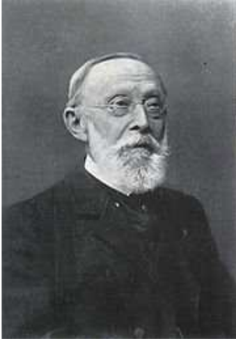
Dr. Rudolf Virchow

Da mesma forma, germes, bactérias, vírus e patógenos não causam doenças, mas antes procuram ambientes onde eles possam se desenvolver melhor --e este ambiente existe em corpos com deficiência de oxigênio.